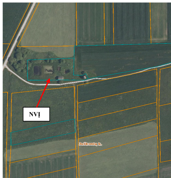
2.1 pav. NVĮ situacijos schema.